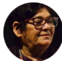
Leinad Carbogin De Olho na Água