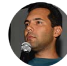
Álvaro Meirelles Floresta Sustentável