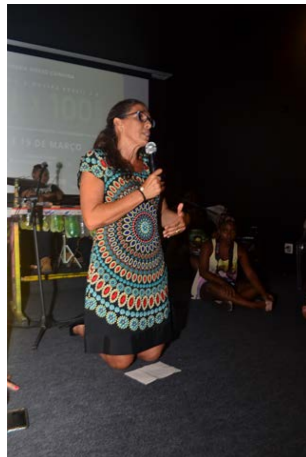
Lilia Ali Delux Comunicação